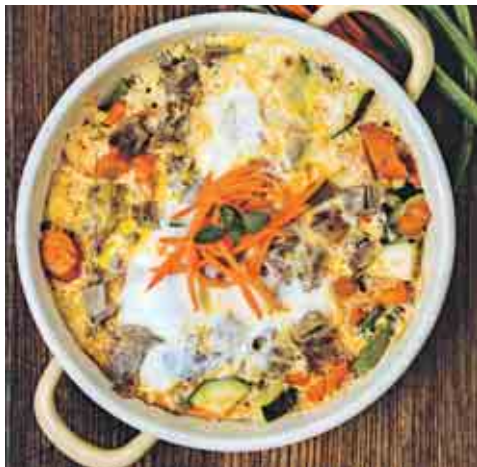
Speisereste, köstlich verkocht TYROLIA