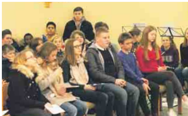
Erfrischend. Viele Kinder und Jugendliche feierten mit Bischof Zsifkovics den Jugendgottesdienst.

Unbewusste Sperre. „Zu Beginn des Gottesdienstes haben wir den Altar deshalb mit Absperrbändern unzugänglich gemacht. Damit wollten wir den Jugendlichen bewusst machen, welche Sperren wir unbewusst errichten und so den Zugang zu Gott erschweren.“ «