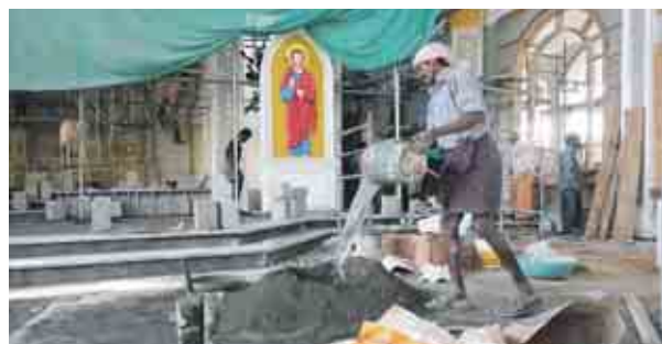
Burgenländer unterstützen Kirchenbau. Das Gotteshaus in Kumily wurde rechtzeitig zum Weihetag fertig.