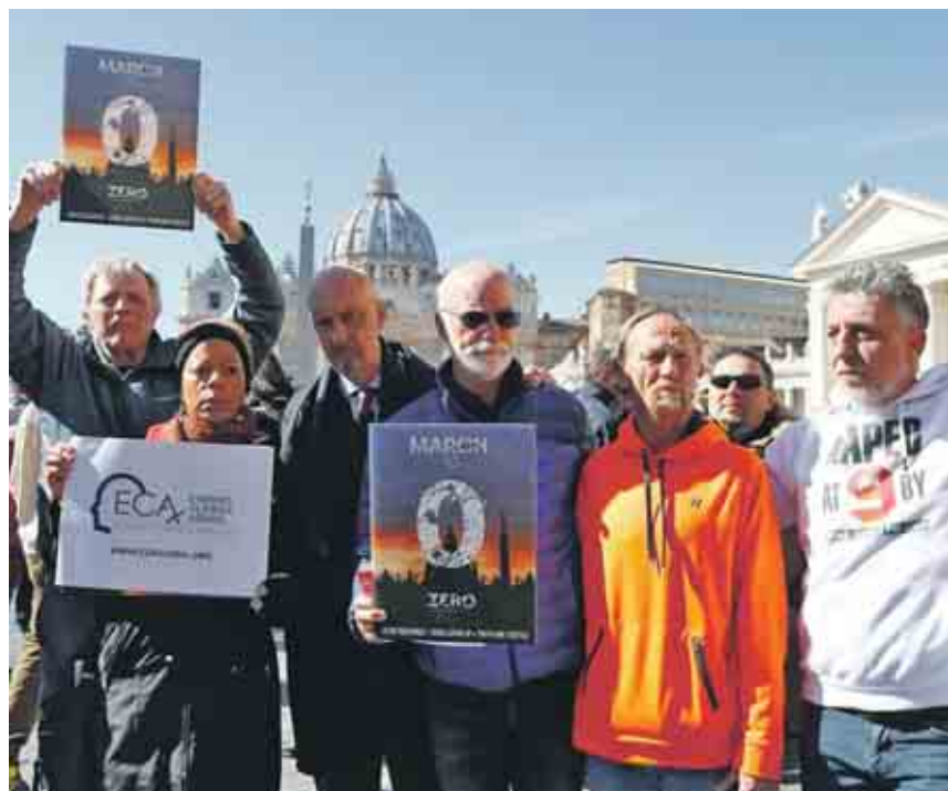
Während die Bischöfe im Vatikan berieten und einen Bußgottesdienst begingen, machten Opferverbände vor den Toren auf ihre Anliegen aufmerksam.

te Kritik in etlichen Medien bestätigt den Widerspruch. Die drei Stunden später bekanntgegebenen nächsten Schritte fingen das nur wenig auf (gemeint sind ein Papst-Erlass „zum Schutz von Minderjährigen und schutzbefohlenen Personen“, der erwähnte Leitfaden und die Task Forces“ zur Unterstützung von Bischofskonferenzen).