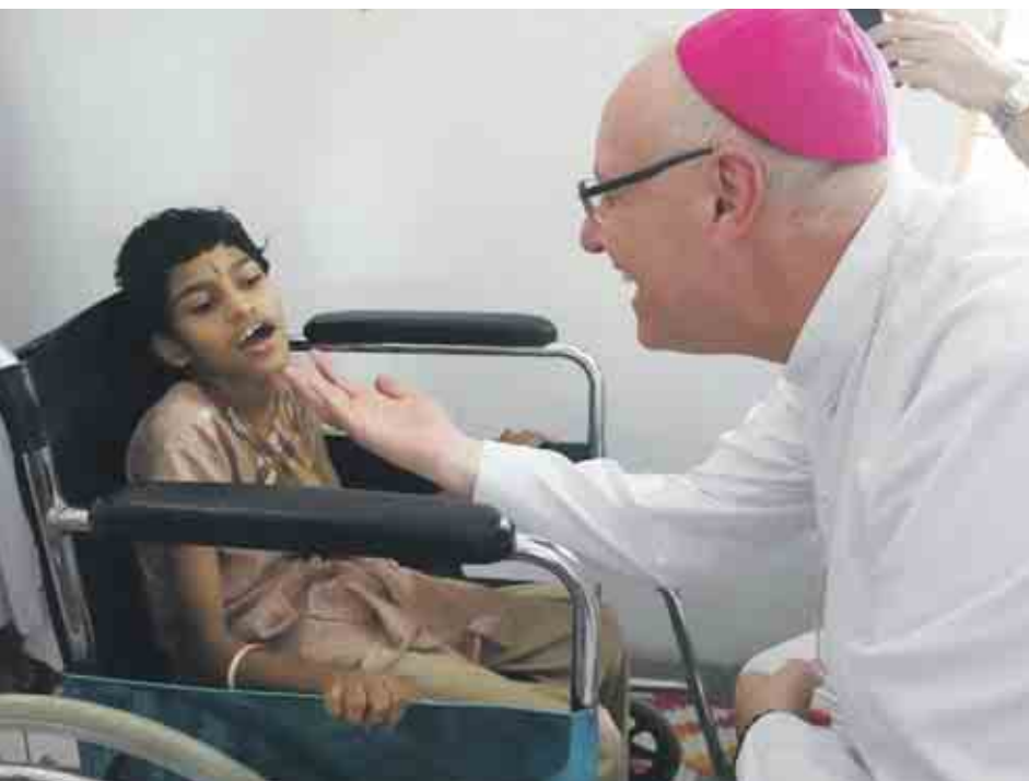
Partnerschaft. Projekte zur Förderung von Behinderten in der indischen Gesellschaft unterstützt die Diözese Eisenstadt seit bald vierzig Jahren. Die Menschen sind dankbar.