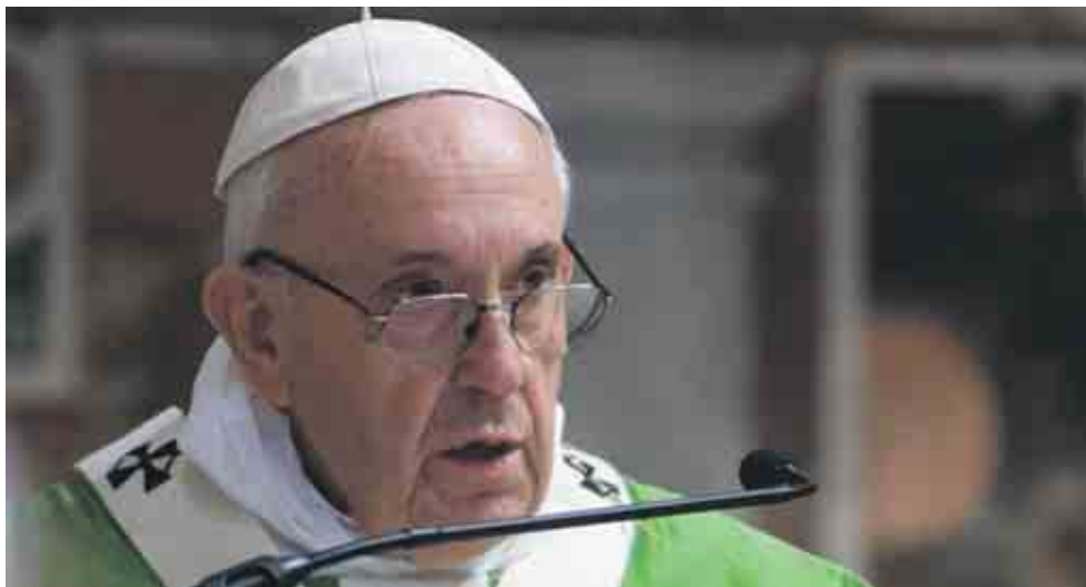
Papst Franziskus betonte in seiner Rede den Zusammenhang zwischen sexuellem Missbrauch und Macht.

Deutliche Kritik. Die Außenwirkung des Treffens indes erlitt einige Stolperer. Ohne sie wäre das Treffen wohl wirksamer und glaubwürdiger gewesen. So durften Opferverbände nur am Rande des Treffens auftreten. Eine kurze persönliche Begegnung mit Franziskus, ein kurzes Statement vor der Vollversammlung hätten Gemüter beruhigt. Auch hatte Franziskus zu Beginn konkrete Schritte gefordert; in seiner Abschlussrede blieb er im Grundsätzlichen. Die promp-