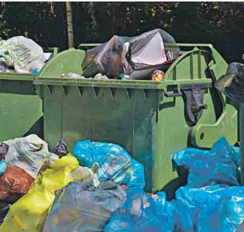
Die Müllberge werden immer größer.