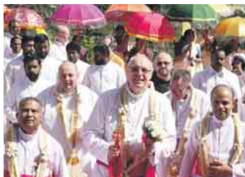
Kirchenweihe. Im Bild vorne: die Bischöfe Arackal (links), Zsifkovics und Pulickal (rechts).

Seit vierzig Jahren unterstützt die Diözese Eisenstadt Hilfsprojekte in der indischen Partnerdiözese Kanjirapally. Dabei stehen die Schwächsten im Mittelpunkt. Auf einer zweiwöchigen Reise besuchten Bischof Ägidius J. Zsifkovics und weitere Burgenländer die groß angelegten Gemeinschaftsprojekte, die auch mit Spenden aus der Fastenaktion finanziert werden. DOMINIK ORIESCHNIG