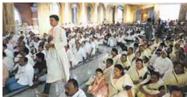
Beeindruckender Gottesdienst. Die Menschen feiern die hl. Messe im Ritus ihrer Vorfahren.

Neuigkeiten aus dem Burgenland erzählen, denen er aufmerksam lauschte.