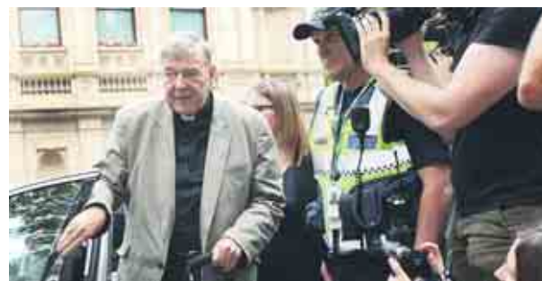
George Pell wurde, wie am Dienstag in der Früh bekannt wurde, bereits im Dezember verurteilt.

Strafe erwartet. Als Präfekt des vatikanischen Wirtschaftssekretariats ist Pell seit Juni 2017 beurlaubt. Am Tag nach dem unter Ausschluss der Medienöffentlichkeit verkündeten Urteil im Dezember 2018 entließ Papst Franziskus den Australier und zwei weitere Kardinäle aus dem einflussreichen Kardinalsrat für die Kirchenreform. Diese Woche wird das Gericht in Melbourne die Beratungen über die Länge der Gefängnisstrafe für Pell aufnehmen. Die Verteidiger von Pell kündigten Berufung gegen die Verurteilung an, das Urteil ist damit nicht rechtskräftig. Der Kardinal bestritt die gegen ihn erhobenen Vorwürfe stets energisch. Das Gericht habe es als erwiesen angesehen, dass Pell vor 22 Jahren als Erzbischof von Melbourne in der Kathedrale der australischen Metropole zwei 13 Jahre alten Buben sexuell missbraucht hat. In einer ersten Reaktion auf das Urteil sprach man im Vatikan von einer „schmerzhaften Nachricht“ und bekundete „höchsten Respekt für Australiens Justizbehörden“. Man werde den Ausgang des Berufungsverfahrens abwarten. Bis es „definitive Fakten“ gebe, seien dem Kardinal die öffentliche Ausübung seines priesterlichen Dienstes sowie jeglicher Kontakt mit Minderjährigen verboten. ◀