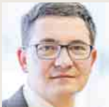
HEINZ NIEDERLEITNER heinz.niederleitner@ koopredaktion.at

Will man den Anti-Missbrauchsgipfel im Vatikan aus mitteleuropäischer Sicht zusammenfassen, wird man sagen müssen: Das meiste, was dort besprochen wurde, war nicht falsch. Aber die Ergebnisse sind zu schwach. Das beginnt bei der Diskussion um das Kirchenrecht. Natürlich müssen die Verfahren transparenter, die Opfereinbindung stärker und die Laienbeteiligung größer werden. Aber das Kirchenrecht alleine ist zu schwach. Die strengste Strafe für Missbrauchstäter ist die Entlassung aus dem Priesteramt und auch das ist unvollkommen: Wer die Strafe