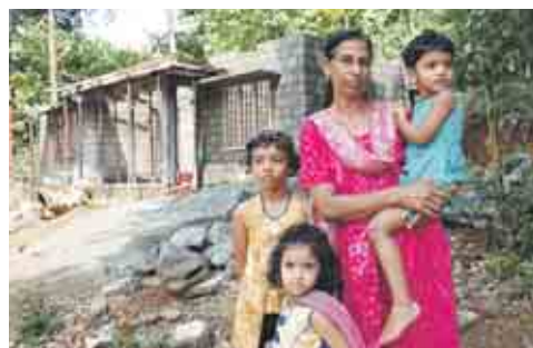
Direkte Hilfe. Eine Mutter mit Kindern vor ihrem Haus, das wiederaufgebaut werden muss.