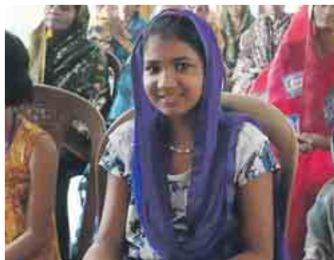
Fröhliche Gesichter sieht man in Indien, trotz der oft sehr einfachen Verhältnisse, überall.