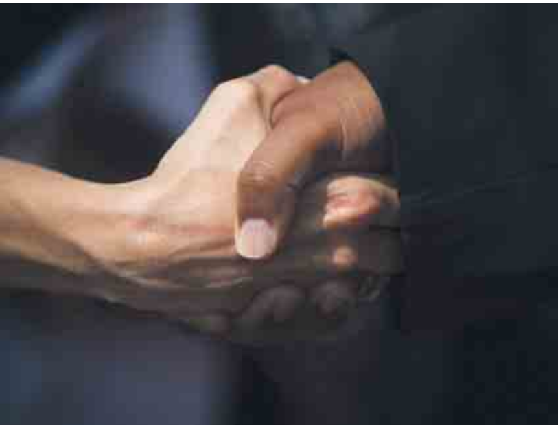
Begegnungen auf Augenhöhe fördern die Menschenrechte.

Polen oder auch Österreich. „Hinzu kommt noch das schrumpfende Vertrauen in verlässliche Institutionen etwa durch Korruption. Ohne öffentliche Institutionen gibt es aber keinen öffentlichen Raum. Und ohne öffentlichen Raum gibt es keine öffentlichen Diskurse. Da wird das Leben eng. All diese Vertrauenskrisen machen das Leben nervös, machen die politische Kultur nervös, hysterisieren Gesellschaften und bieten den Boden, wo die Saat des Hasses aufgehen kann.“